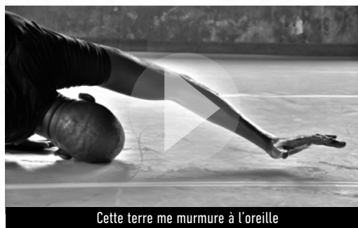
Cette terre me murmure à l'oreille

Coproduction : Les Francophonies en Limousin, Le Centre Chorégraphique national de Tours