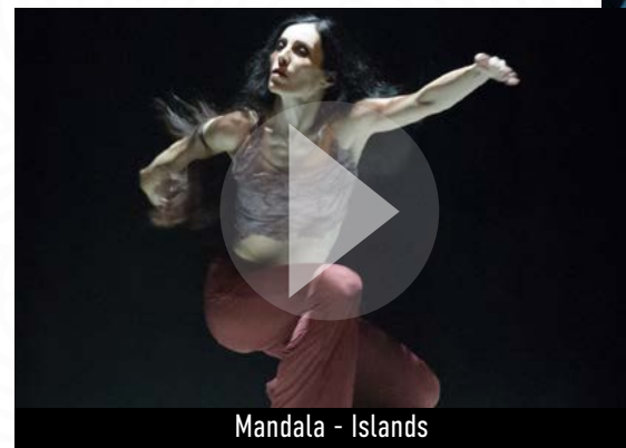
Mandala - Islands

Le solo est la forme de prédilection de Carolyn Carlson depuis les années 70 et son fameux Density 21.5 qui la fit nommer chorégraphe-étoile. Depuis elle n'a cessé d'alterner création de groupe/ballet et soli pour elle-même ou des danseurs qui l'inspirent profondément. Il constitue la forme essentielle du travail chorégraphique. C'est le moment d'un rapport direct à la danse, la possibilité d'un retour sur soi et d'une recherche de la note ultime du geste unique et pur... une communication visuelle par l'émotion, par la perception, sans le détour de la parole.