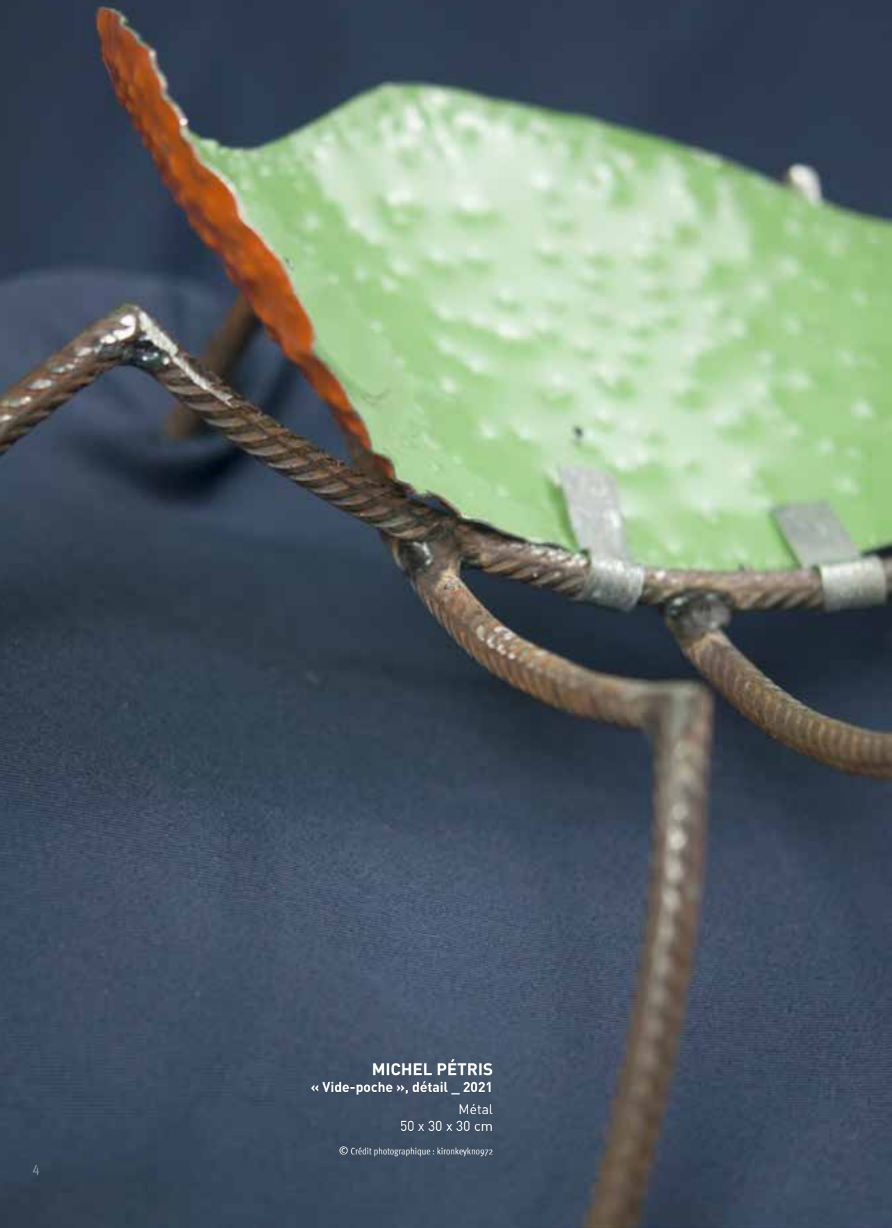
MICHEL PÉTRIS « Vide-poche », détail _ 2021 Métal 50 x 30 x 30 cm