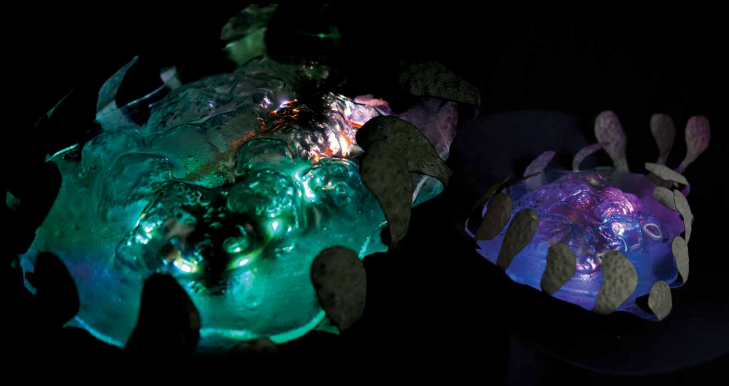
MICHEL PÉTRIS « Abysse », 2012 Métal & verre Dimensions variables