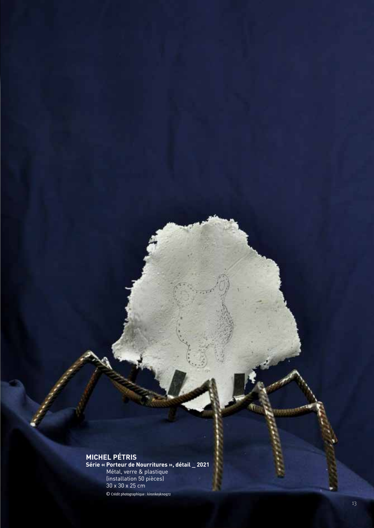
MICHEL PÉTRIS Série « Porteur de Nourritures », détail _ 2021 Métal, verre & plastique (installation 50 pièces) 30 x 30 x 25 cm