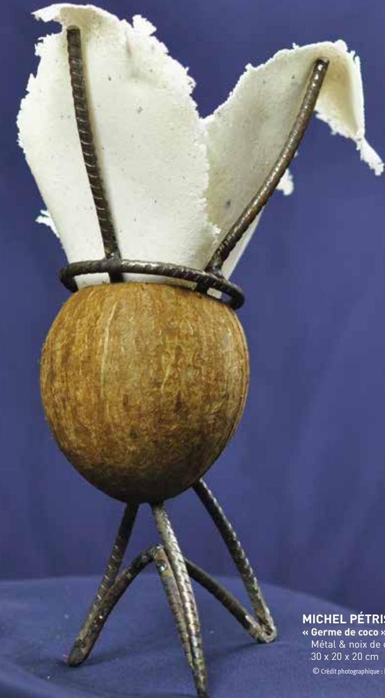
MICHEL PÉTRIS « Germe de coco », 2020 Métal & noix de coco 30 x 20 x 20 cm

La mémoire trouve ici un écosystème où elle peut encore exister et s'épanouir, car c'est le lieu où existe encore l'objet quand il devient absent.