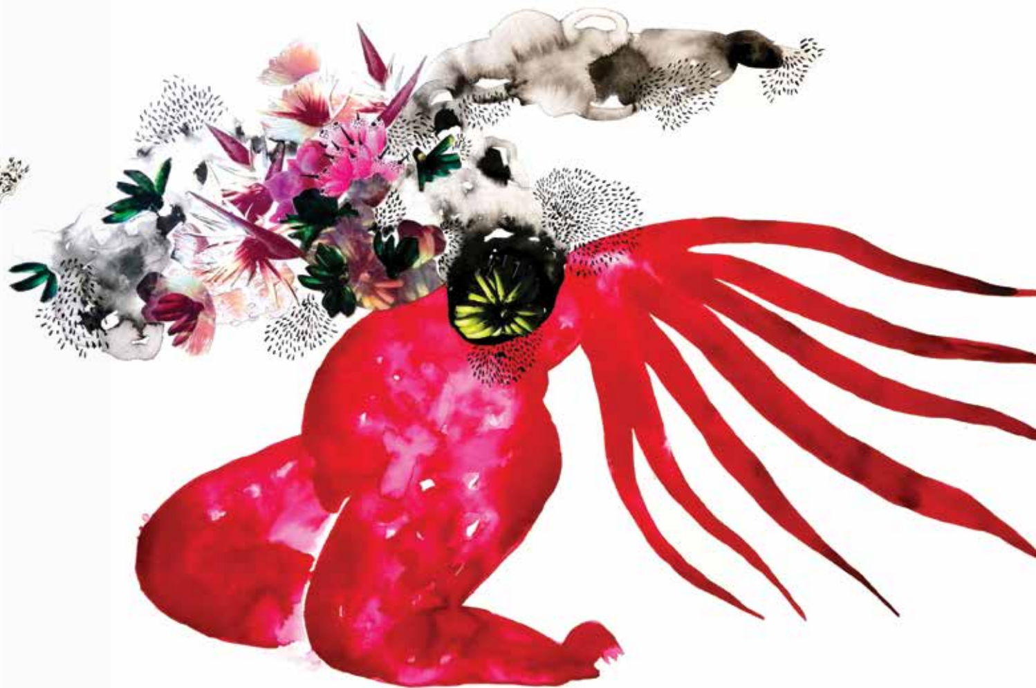
GWLADYS GAMBIE « Poison », 2019 Encre sur papier, collage 60 x 80 cm