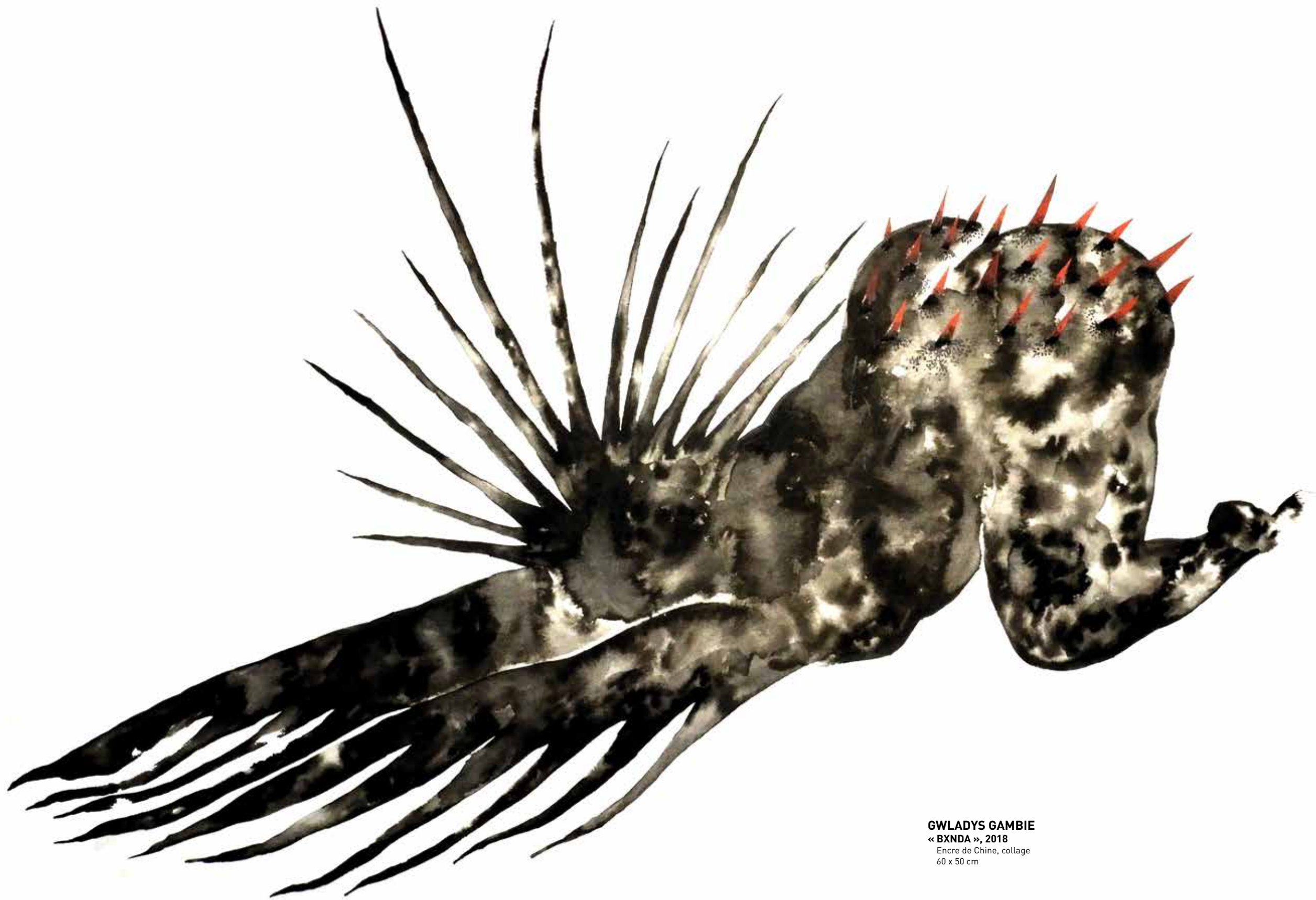
GWLADYS GAMBIE « BXNDA », 2018 Encre de Chine, collage 60 x 50 cm