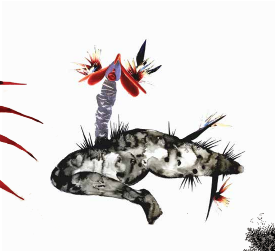
GWLADYS GAMBIE « Poto mitan 1 », 2018 Encre sur papier, collage 55 x 50 cm