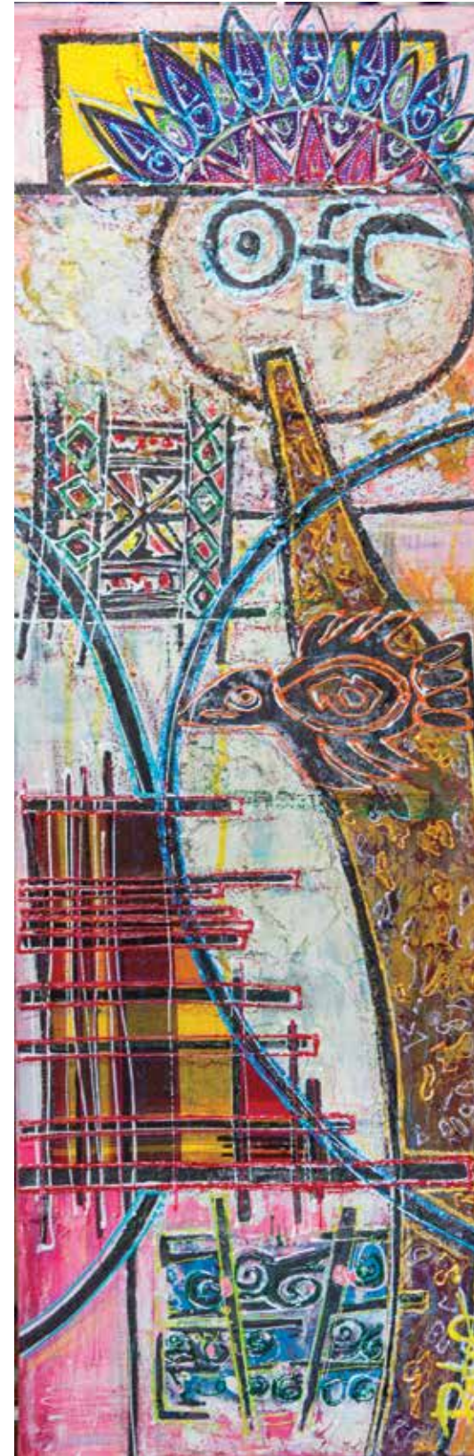
BABOO « KRÉYOLANS », 2019 Techniques mixtes 30 x 90 cm