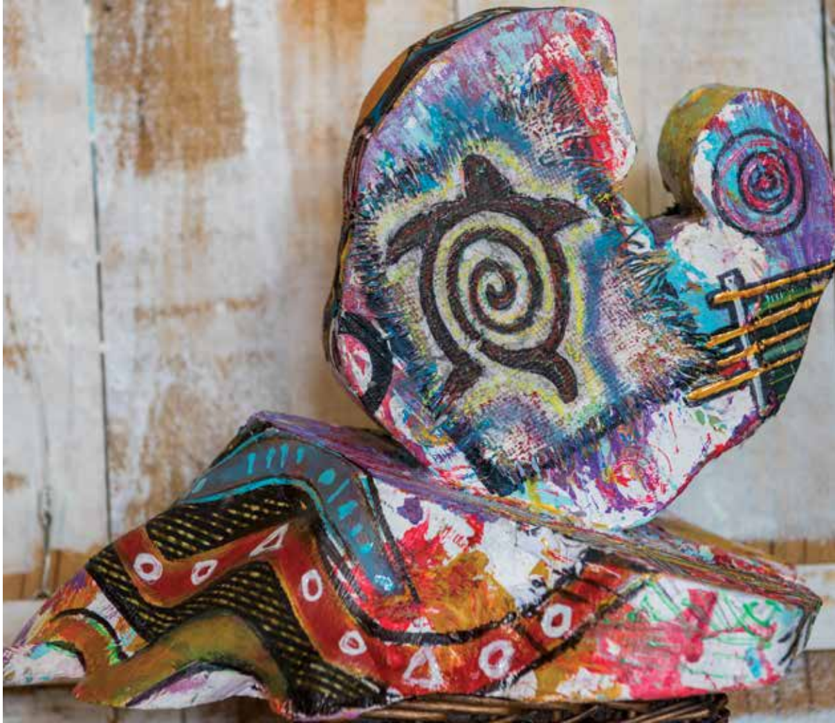
BABOO « MI DÉBA », 2019 Techniques mixtes 33 x 28 x 23 cm