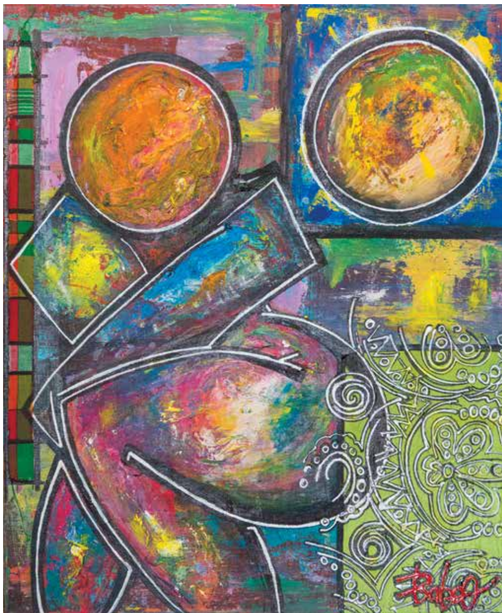
BABOO « LAWONNLALINN », 2019 Techniques mixtes 54 x 65 cm