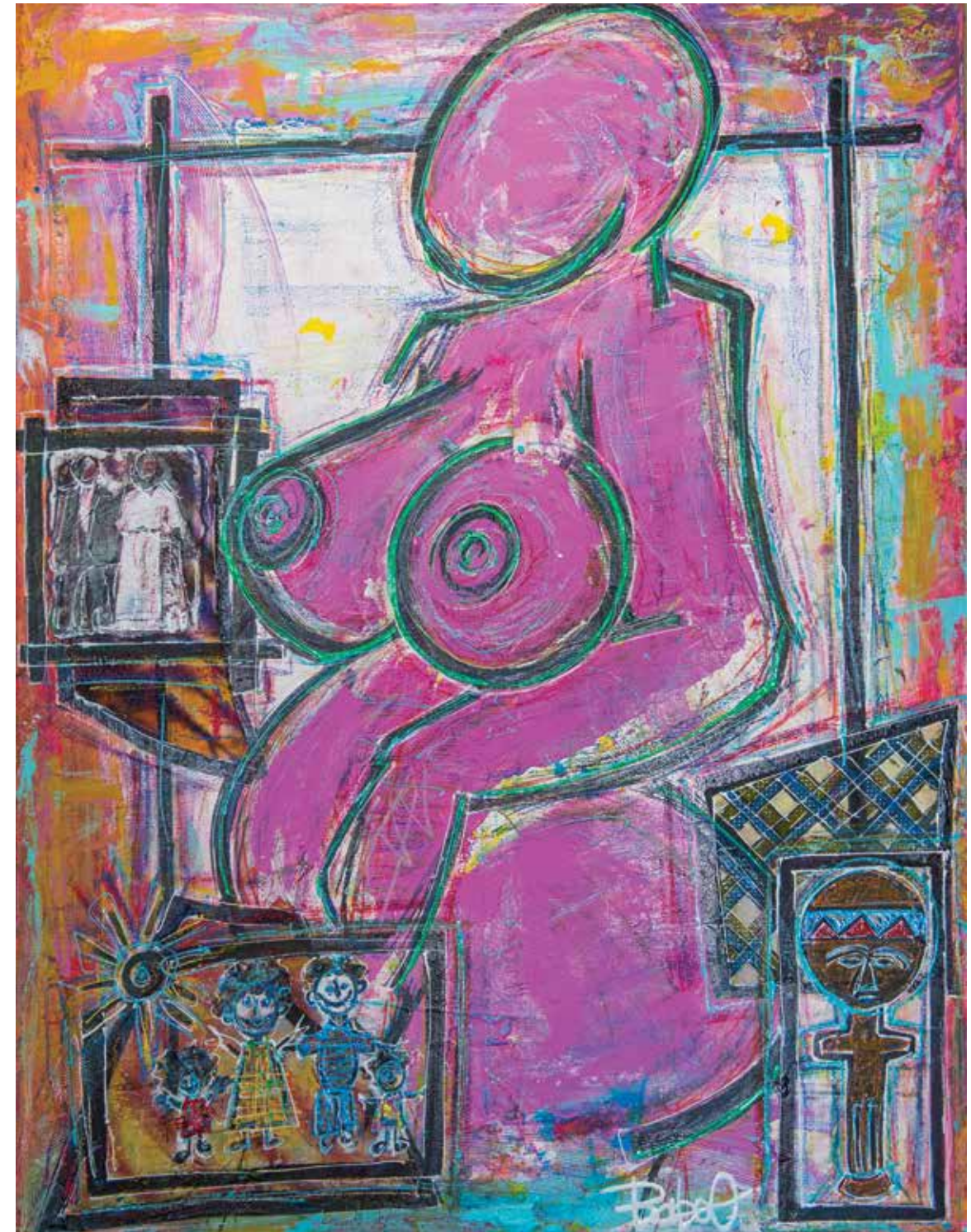
BABOO « MASA », 2019 Techniques mixtes 70 x 90 cm

Immarcescible , l'exposition indéfectible mais humblement accessible.