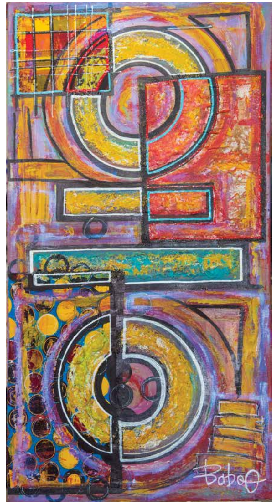
BABOO « TING BANG », 2019 Techniques mixtes 50 x 95 cm