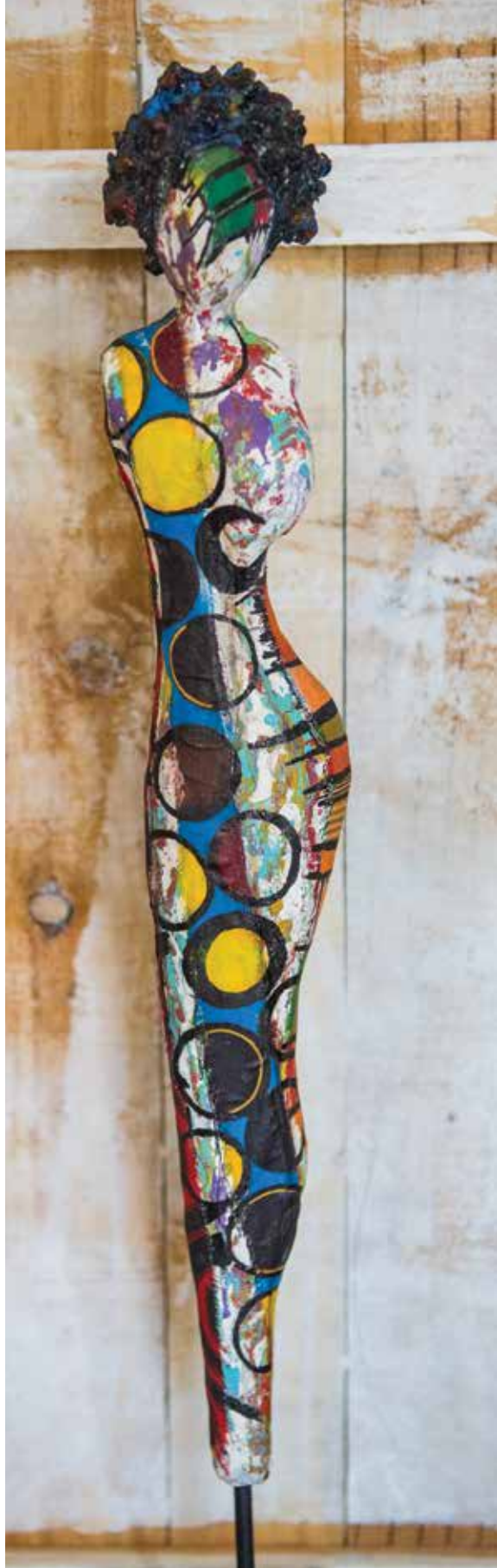
BABOO « SOA », 2019 Techniques mixtes 74 x 10 cm