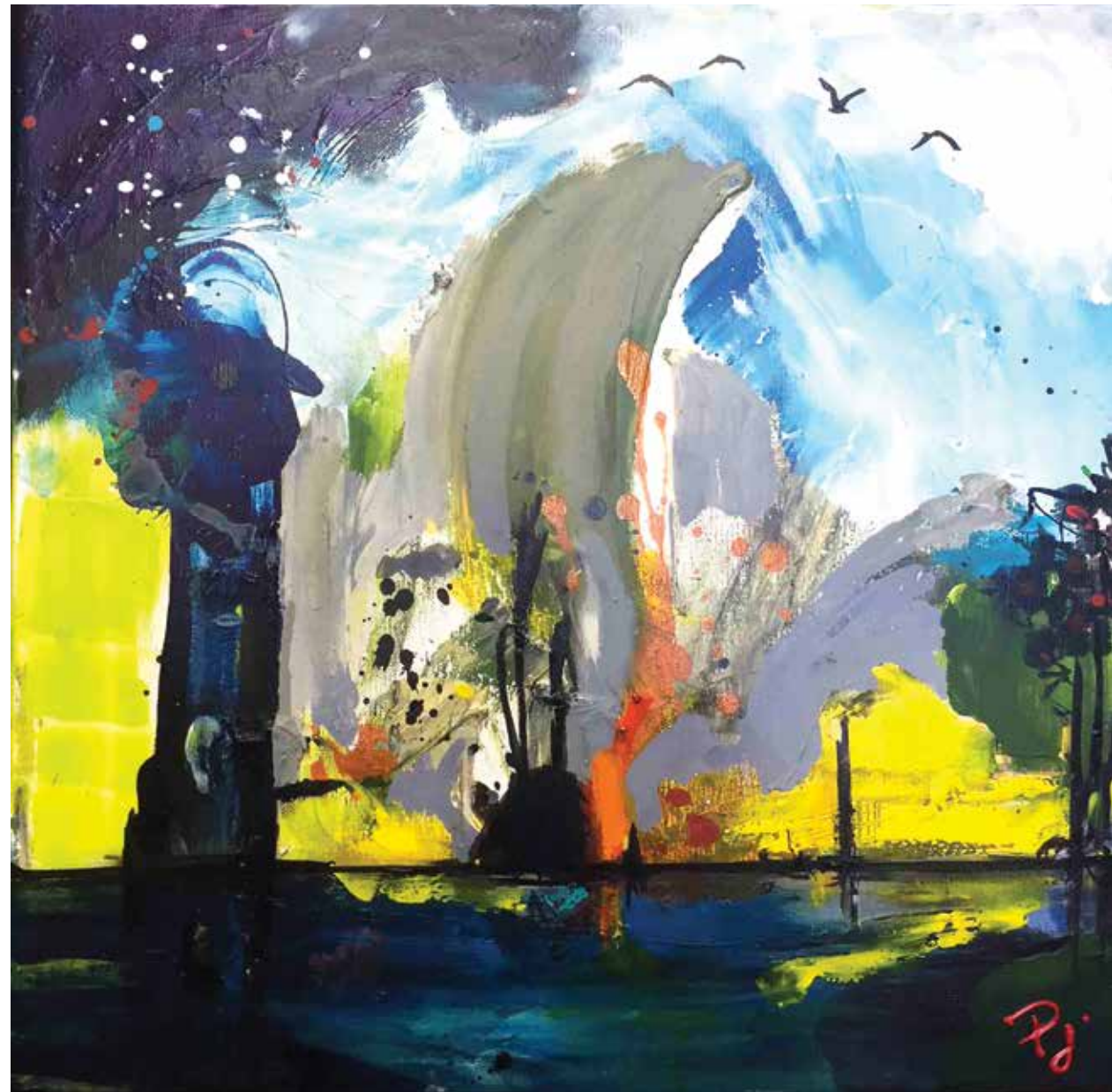
PRISCART « REFLET 7 », 2017 Acrylique sur toile _ 30 x 30 cm Collection Reflot d'essentiel