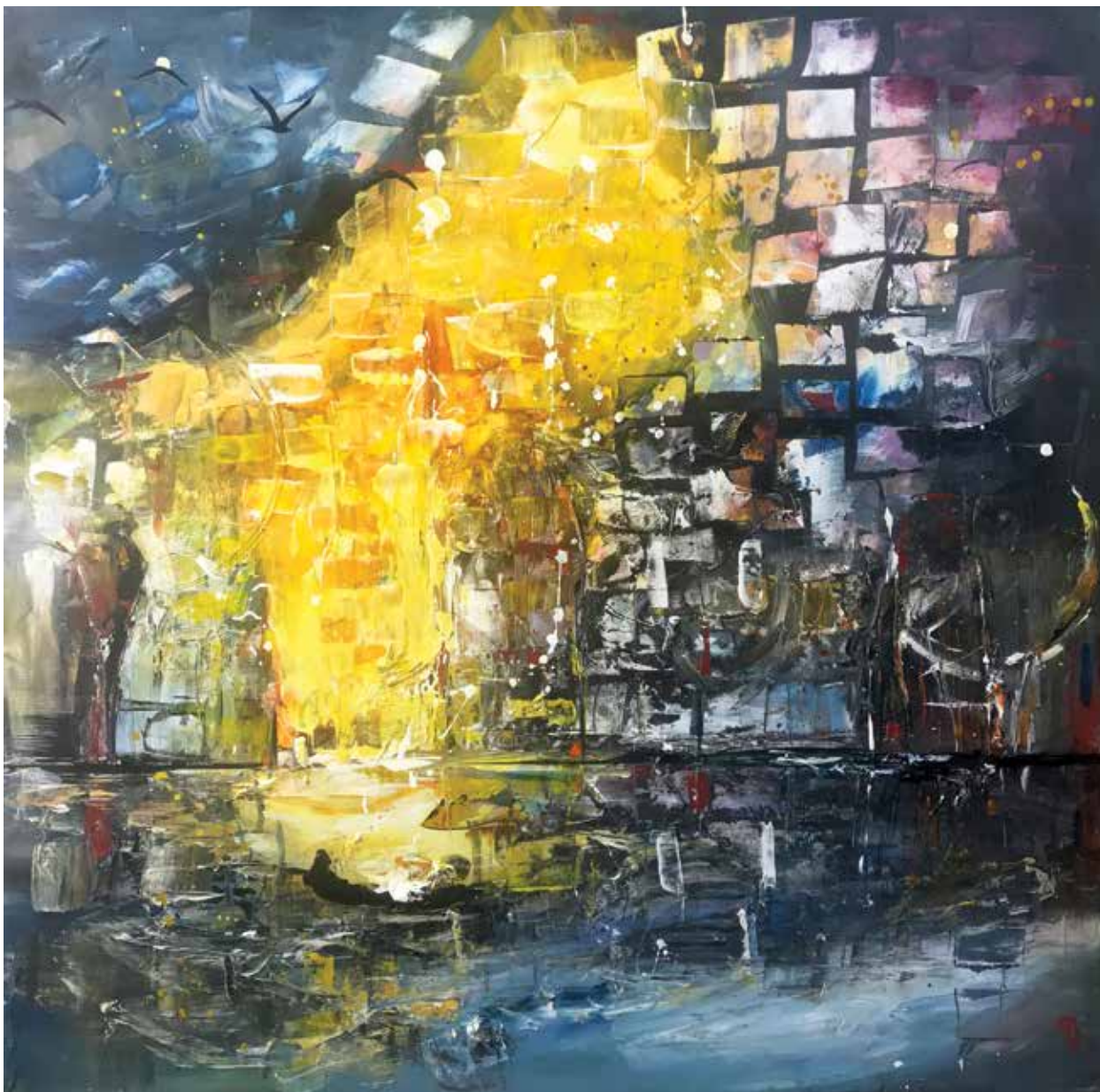
PRISCART « FORCE INTÉRIEURE », 2019 Acrylique sur toile _ 80 x 80 cm Collection Reffet d'essentiel