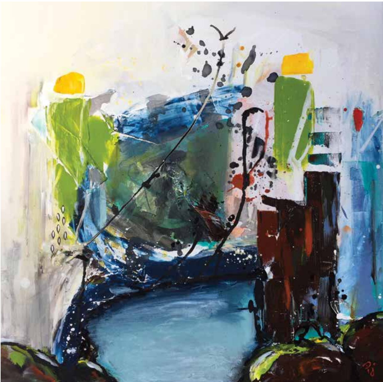
PRISCART « ENTRE DEUX EAUX », 2017 Acrylique sur toile _ 60 x 60 cm Collection Reflot d'essentiel