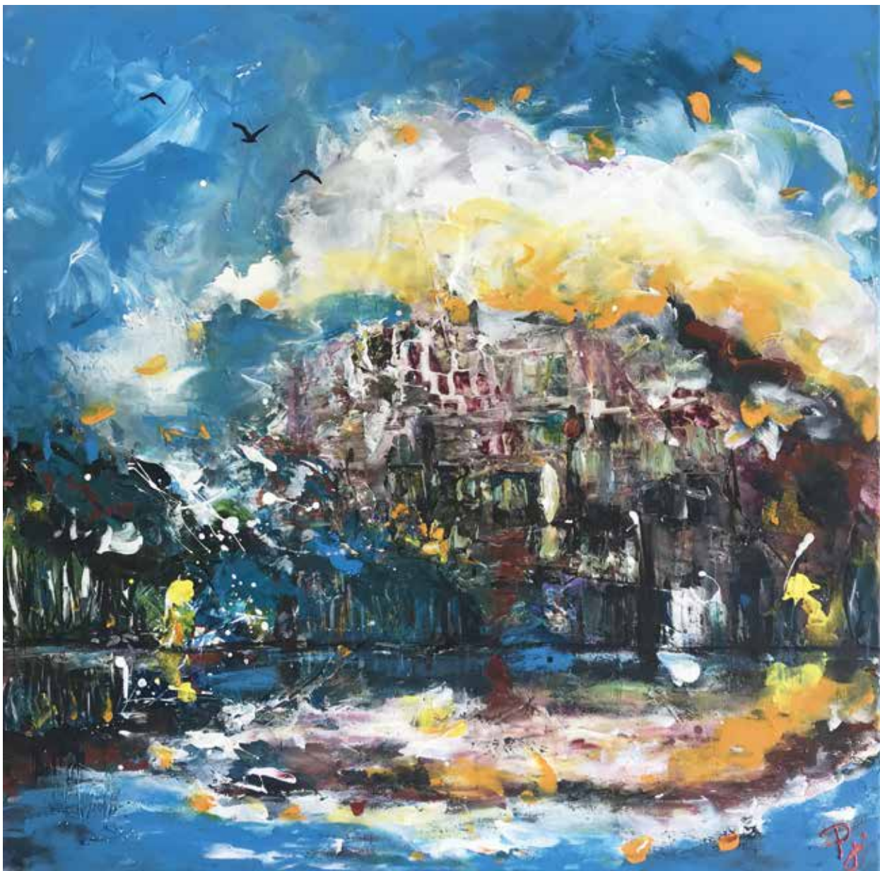
PRISCART « MONDE INTÉRIEUR (SOUS-MARIN) », 2019 Acrylique sur toile _ 50 x 50 cm Collection Reffet d'essentiel