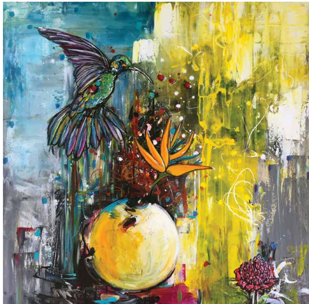
PRISCART « BIGUINE JAZZ CARAÏBES », 2017 Acrylique sur toile _ 80 x 80 cm Collection Traces