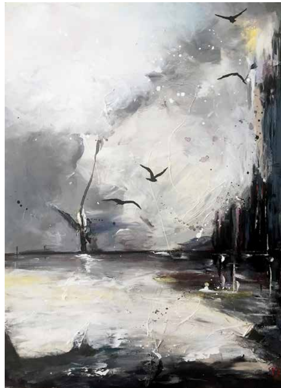
PRISCART « MÉDITATION », 2018 Acrylique sur toile _ 60 x 80 cm Collection Japonismes