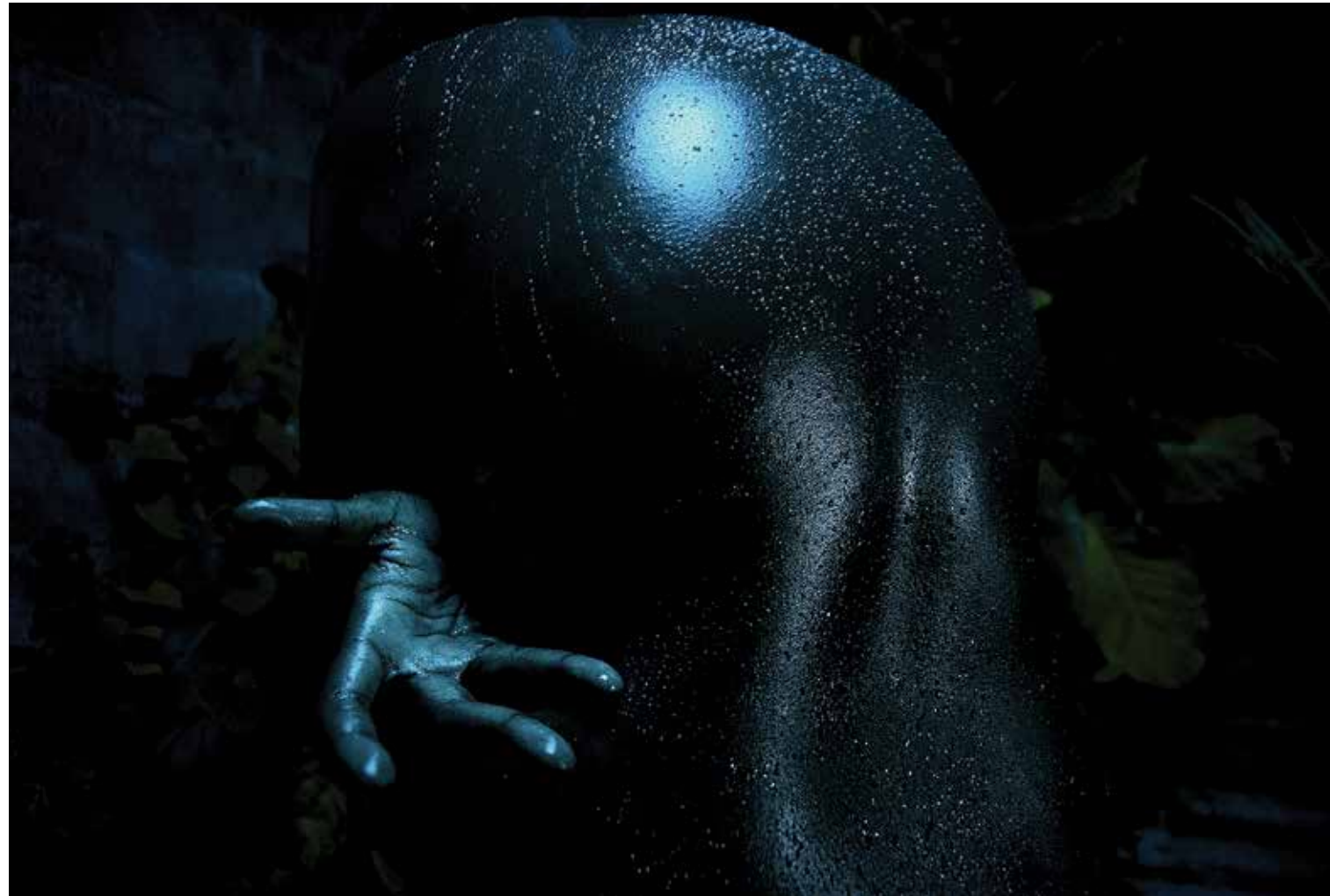
MIRTHO LINGUET « A mental-cide, un bain démarré » Photographie sur papier baryté contercollée sur PVC expansé 80 x 106 cm _ 2015 Courtesy de l'artiste _ Prêt Maëlle Galerie