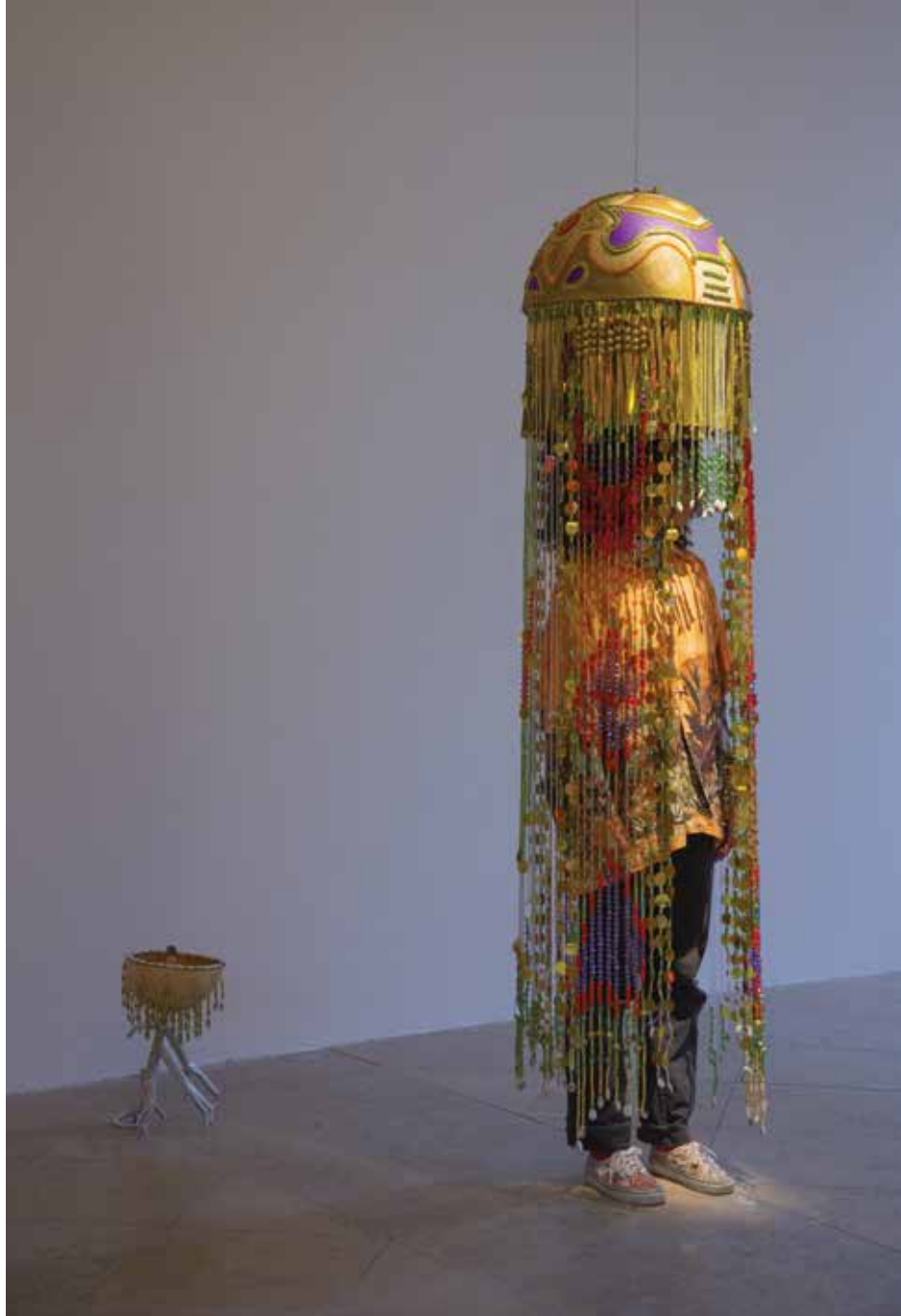
SHIVAY LA MULTIPLE « À la recherche du fruit ligneux : ciel qui parle » Techniques mixtes : calabasse, perles, paillettes, cauris, haut-parleur, ode à la calabasse _ 165 x 80 x 80 cm _ 2022 Prêt Shivay La Multiple _ © Crédit photo : DR