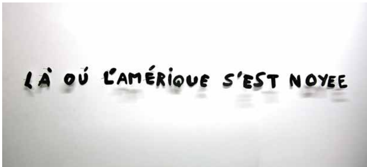
JEAN-FRANÇOIS BOCLÉ « Sans titre » Série Entomologies poétiques Technique mixte _ Dimensions variables _ 2022 Courtesy Maëlle Galerie _ Prêt Jean-François Boclé _ © Crédit photo : DR