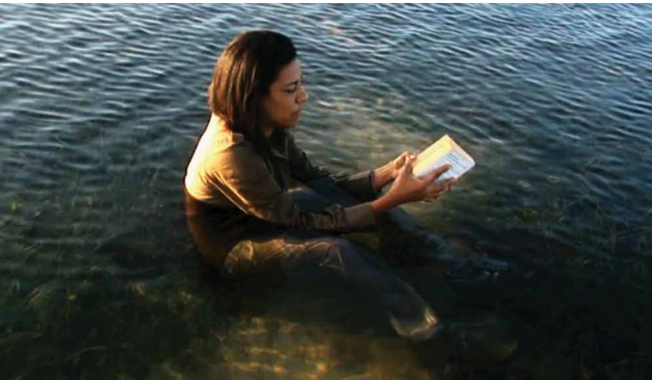
MYRIAM MIHINDOU « Père Ortin, Ophélie, Rabat 2008 » Images : Alex Guimerà Arias, 5'3. Un projet porté par Elvira Dynagani Ose commissaire. Rabat 2008

Courtesy Myriam Mihindou/Galerie Maïa Muller _ Prêt Galerie Maïa Muller © We are here ! Films, Barcelona, 2008