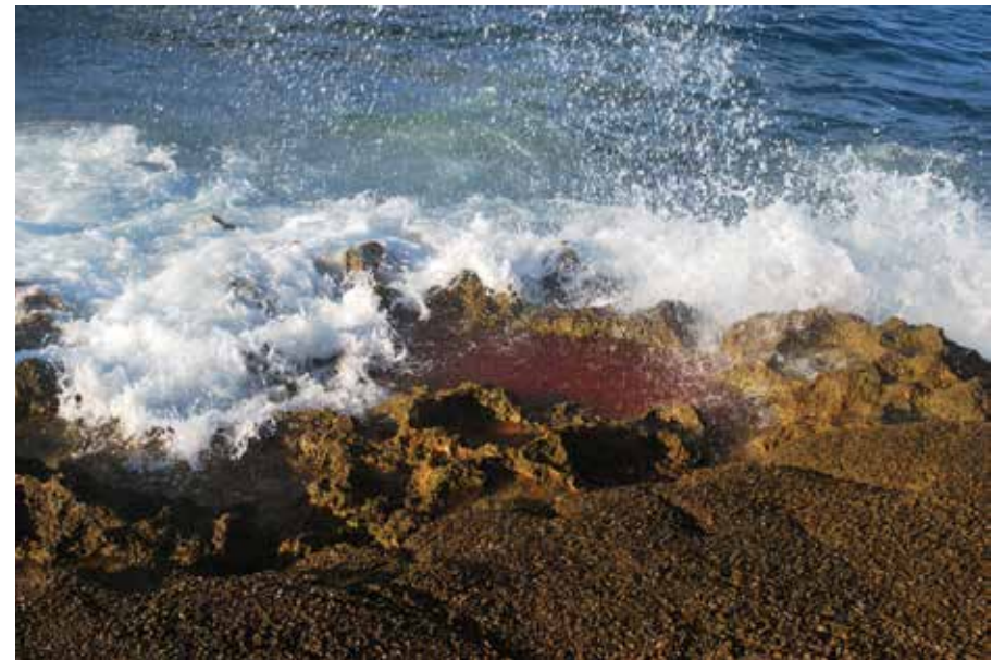
LOUISA MARAJO « Chantier de la mer 3 & 2 » Impression sur papier _ 80 x 60 cm _ 2020 Courtesy, copyright & prêt Louisa Marajo