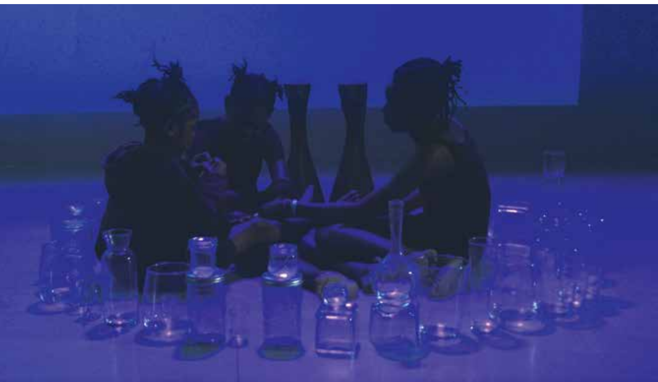
BORGIAL NIENQUET-ROGER « Aquaphobia » Installation : projection vidéo, 4'00 mn. Collection FRAC Lorraine