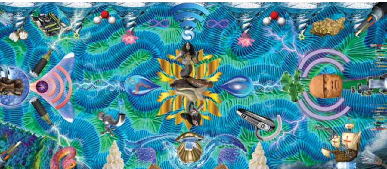
TABITA RÉZAIRE « Dilo » Impression numérique _ 100 x 188 cm _ 2017