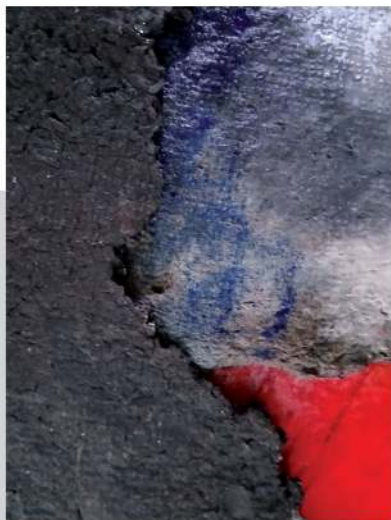
Puissance d'Être (détail) Papier fait main, acrylique Ensemble de 3 pièces dim. 145/49 cm 2025