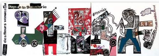
Hiatus Installation Acrylique sur toile dim. 50/150cm Socle haut. 100 cm Livres, bloc de béton 2025

I HIATUS symbolise une rupture face au patriarcat et aux violences qu'il engendre. Inspirée du mouvement #MeToo et du livre Le Consentement de Vanessa Springora, l'installation incarne la prise de conscience autour du consentement et des rapports de pouvoir.