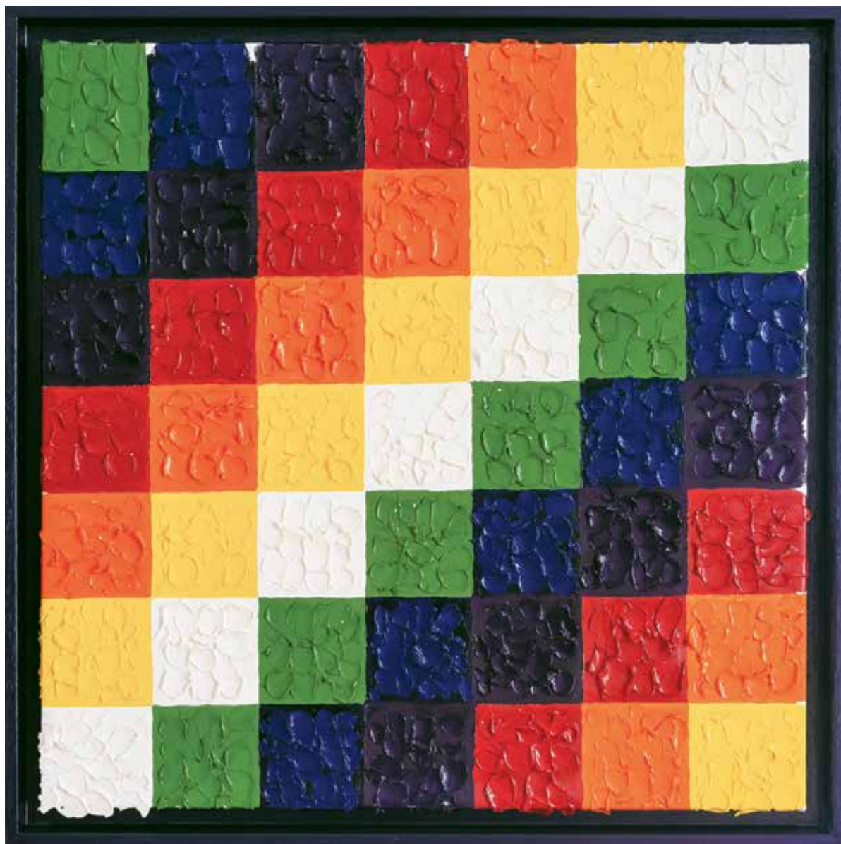
RÉGIS GRANVILLE « THE WIPHALA » - « Peuple Aymara » - 2022 Huile sur toile encadrée - 50 x 50 cm © Régis Granville