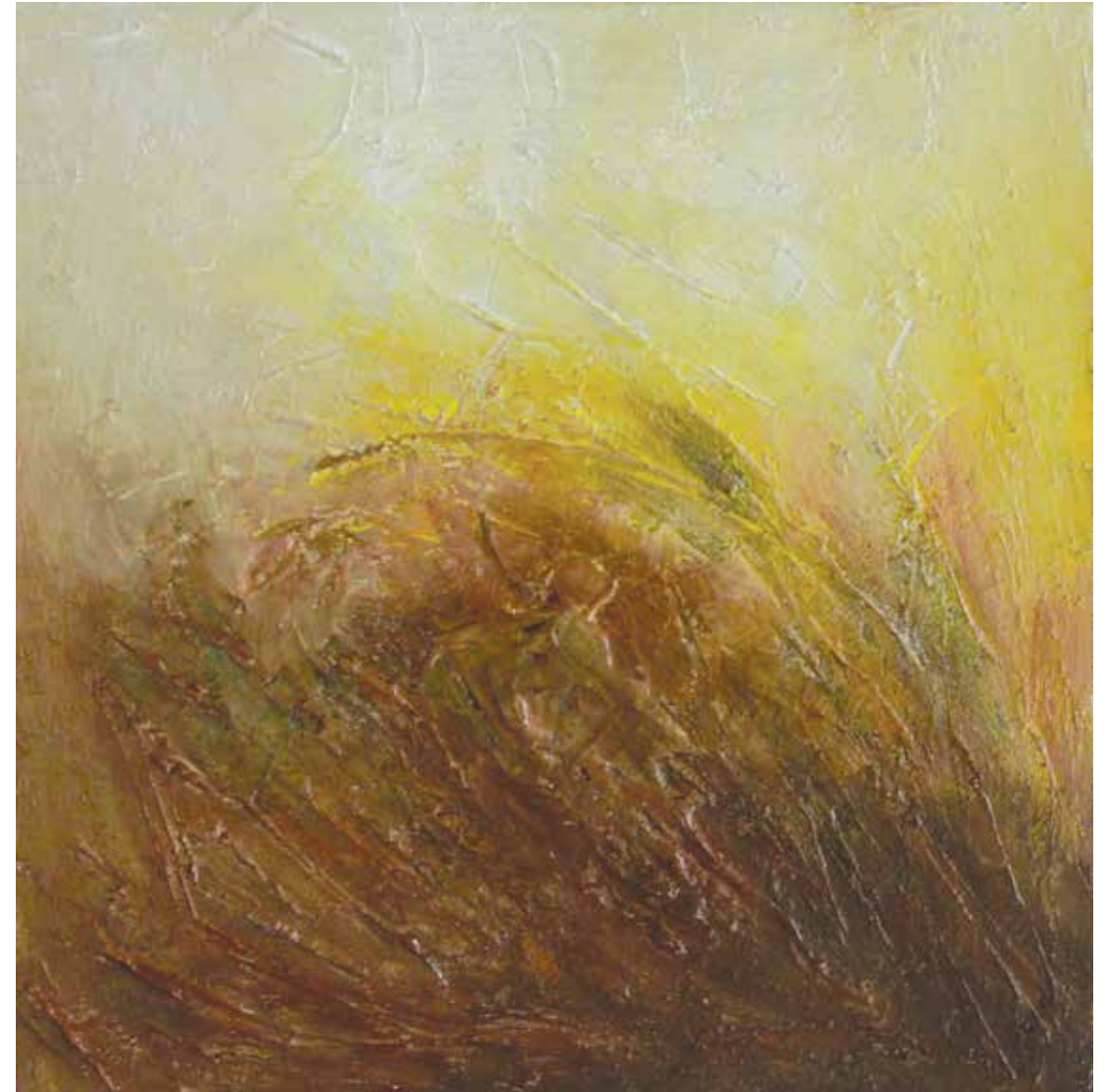
MARK « GÉOLOGIQUE » _ Série Espace Minéral Technique mixte 50 x 50 cm © O. Joseph