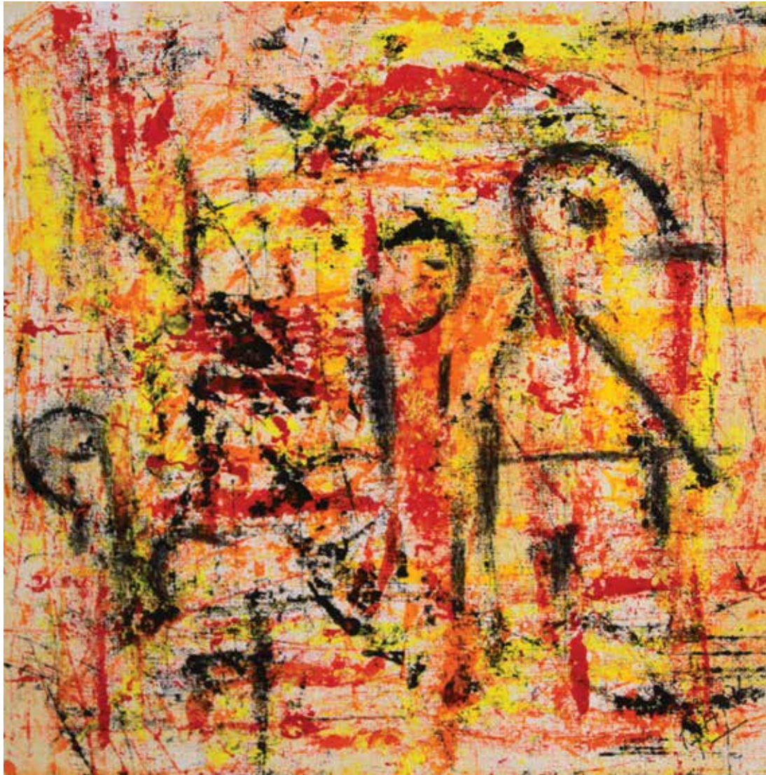
MARK « KARIBS » _ Série Espace Caraïbe Technique mixte 30 x 30 cm