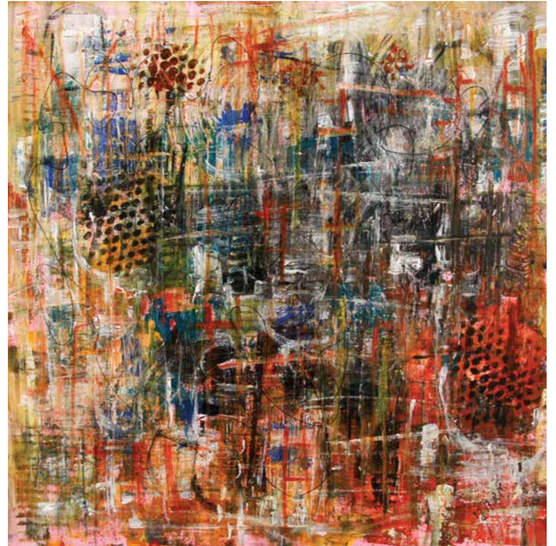
MARK « MÉTROPOLIS » Technique mixte 40 x 40 cm © O. Joseph