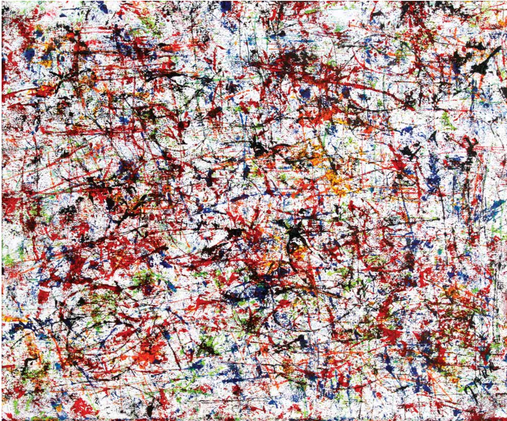
MARK « SYMPHONIE FANTASTIQUE » Technique mixte 46 x 38 cm © O. Joseph