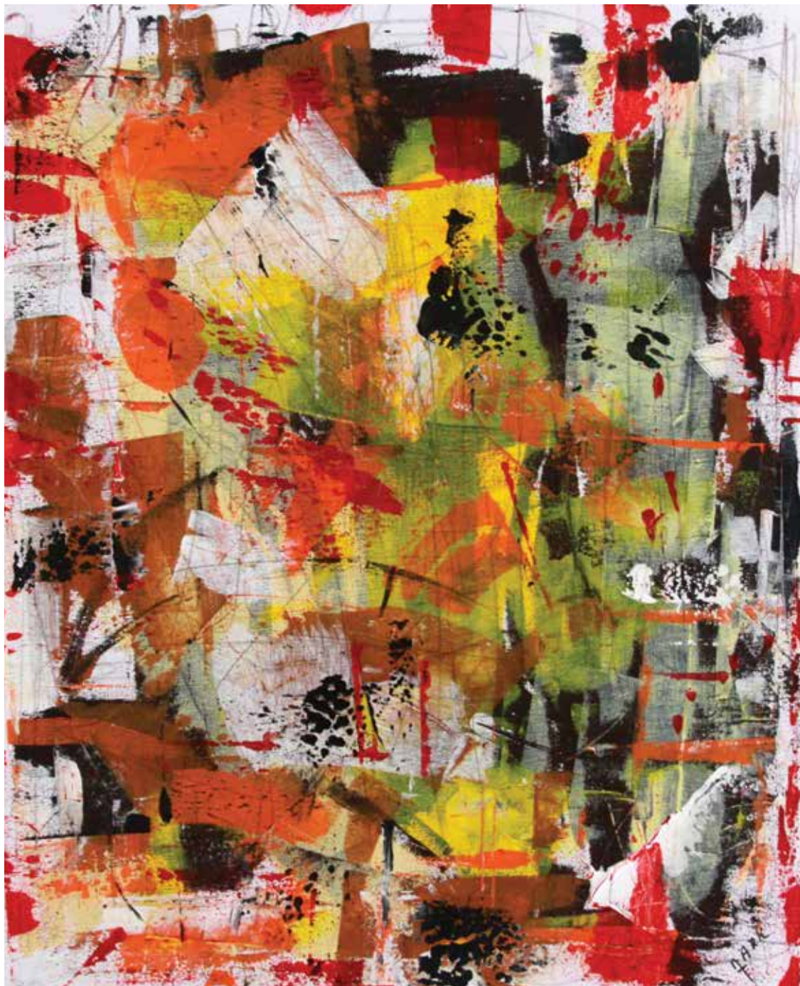
MARK « SANGUINE » Technique mixte 55 x 46 cm