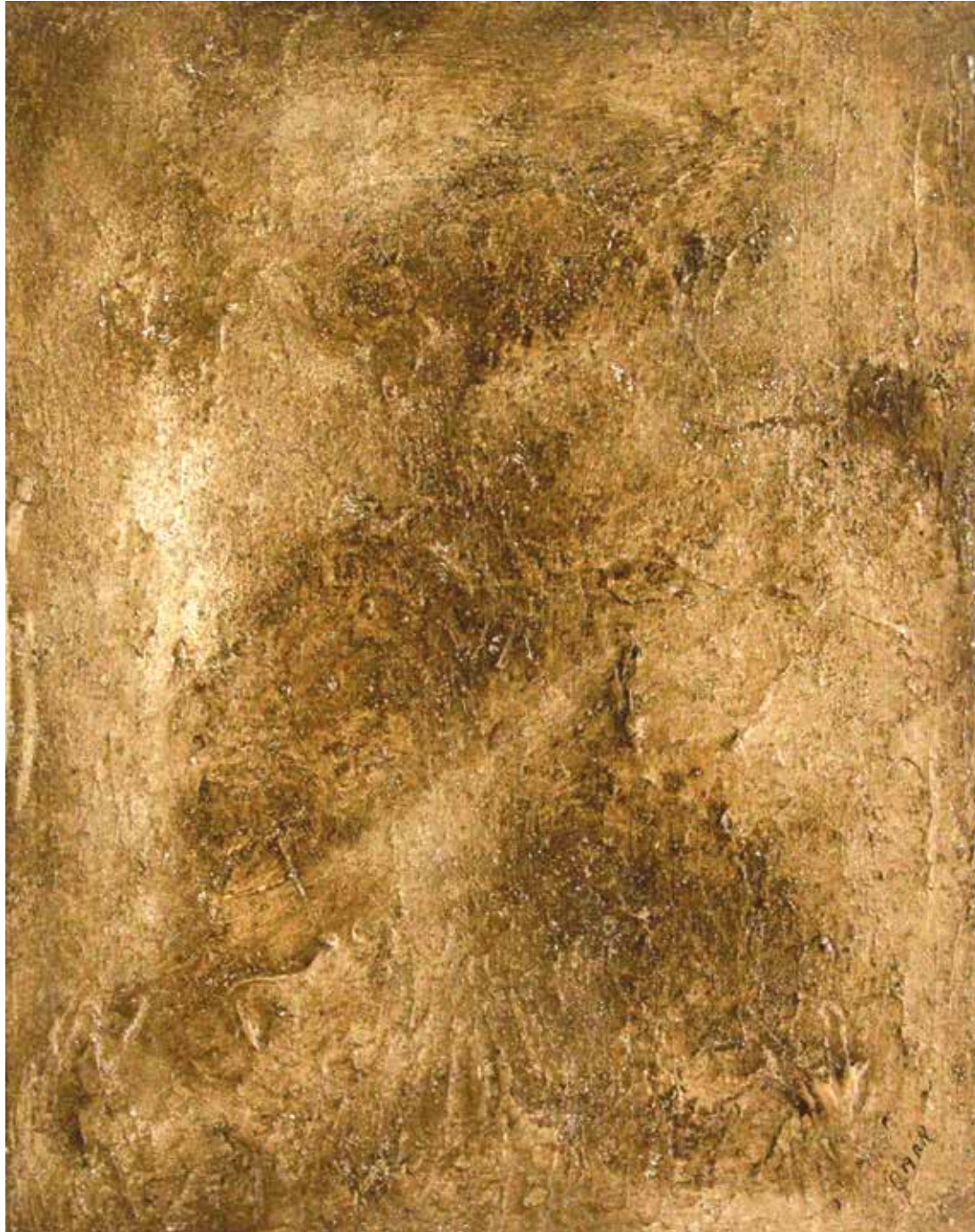
MARK « PÉTRUS » _ Série Espace Minéral Technique mixte 50 x 40 cm © O. Joseph